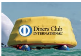
マーク 1、マーク 2