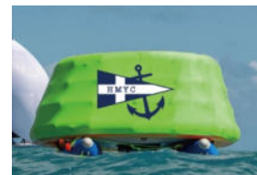
スタートマーク フィニッシュマーク