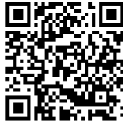
Official Notice Board